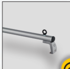
Verstellbare Befestigungsöse. (Option)