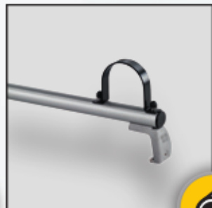
Rohrklemmen lieferbar in 110, 125 und 160 mm Ø (Option)